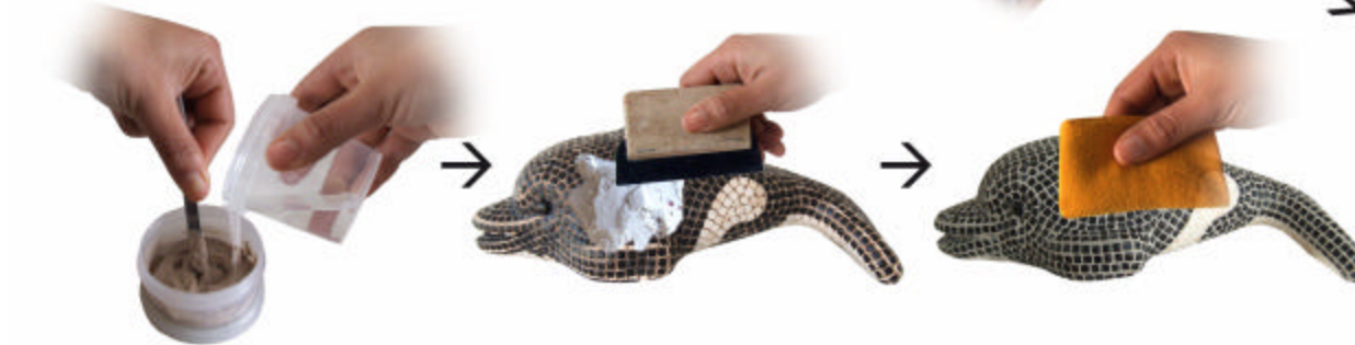
Mélanger le produit de joint ensuite étaler la patte sur tout la surface entre les tesselles