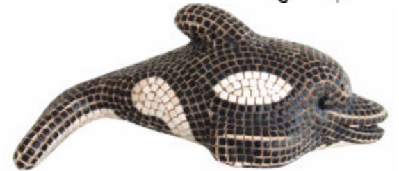
Laissez sécher 20 mn puis frotter délicatement avec un chiffon doux