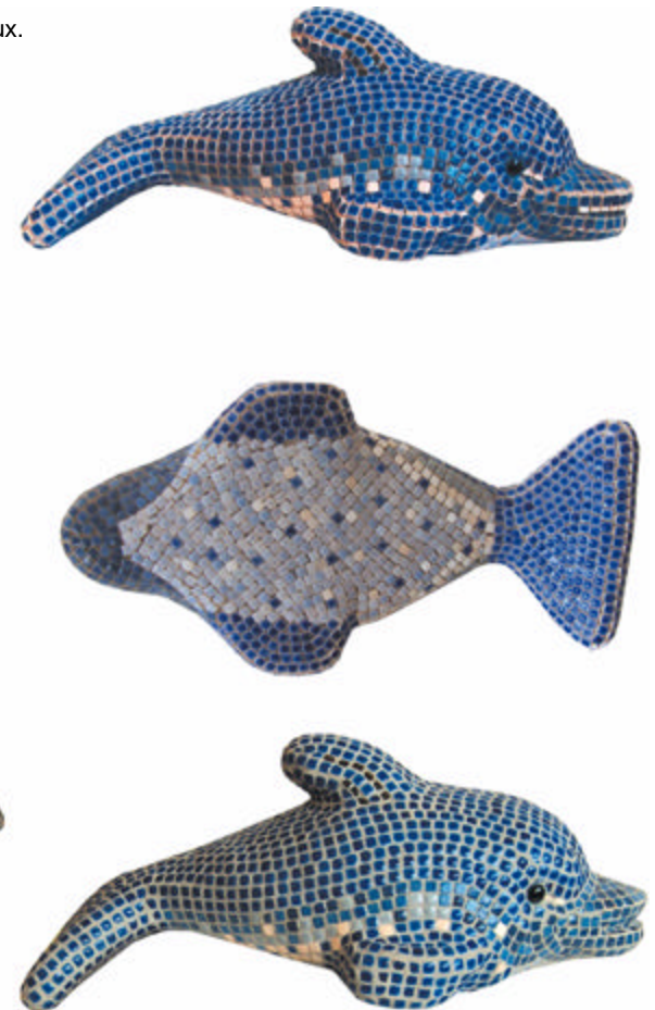
Laissez sécher 20 mn puis frotter délicatement avec un chiffon doux