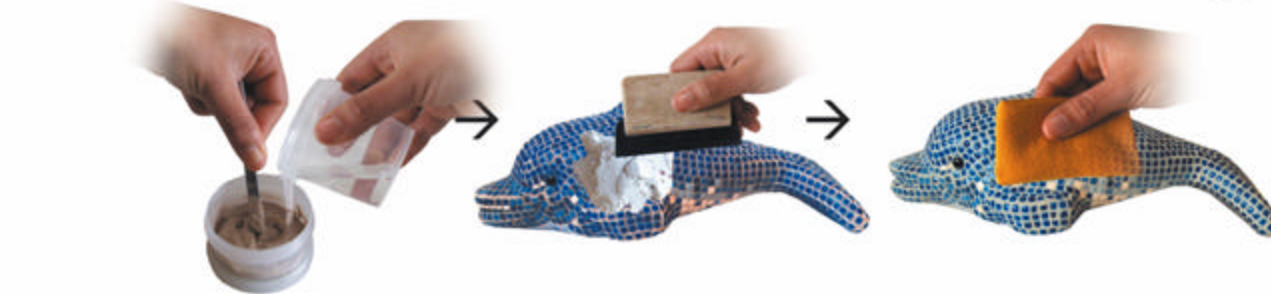
Mélanger le produit de joint ensuite étaler la patte sur tout la surface entre les tesselles